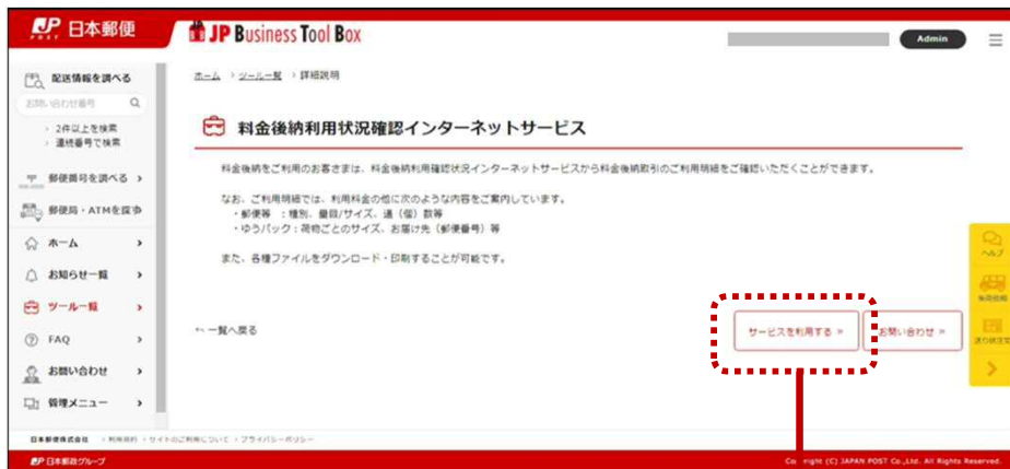
サービス詳細説明画面